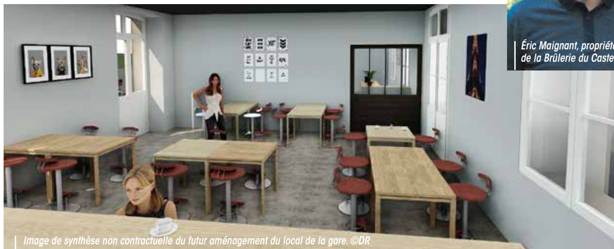
Image de synthèse non contractuelle du futur aménagement du local de la gare.

Le quartier de la gare accueillera bientôt un coffee shop, qui prendra place dans l'ancien bâtiment SNCF. Coup de projecteur sur cette nouvelle enseigne qui ravira les gourmands, les curieux, les pressés comme les flâneurs.