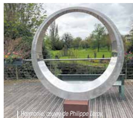
Harmonie, œuvre de Philippe Leray.