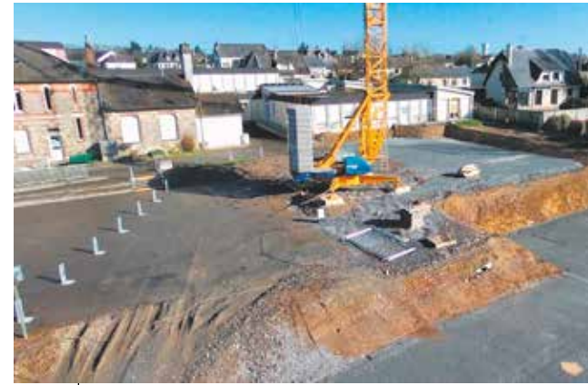
Janv Débutés en janvier, les travaux d'extension de l'école Charles de Gaulle dureront jusqu'en mai 2025. Ce sera ensuite au tour de la rénovation énergétique (isolation par l'extérieur, renouvellement des menuiseries et mise aux normes sécurité). Un travail de végétalisation de la cour est à l'étude. La fin du chantier est prévue au printemps 2026.