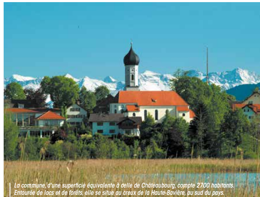
La commune, d'une superficie équivalente à celle de Châteaubourg, compte 2700 habitants. Entourée de lacs et de forêts, elle se situe au creux de la Haute-Bavière, au sud du pays.

Le jumelage Châteaubourg-Iffeldorf possède d'immémorables souvenirs à son actif, et compte bien en créer de nouveaux cette année.