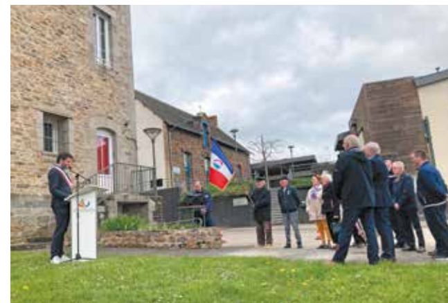
19 mars Élus et associatifs de la Fnaca ont célébré la journée nationale du souvenir et du recueillement à la mémoire des victimes civiles et militaires de la guerre d'Algérie et des combattants en Tunisie et au Maroc.