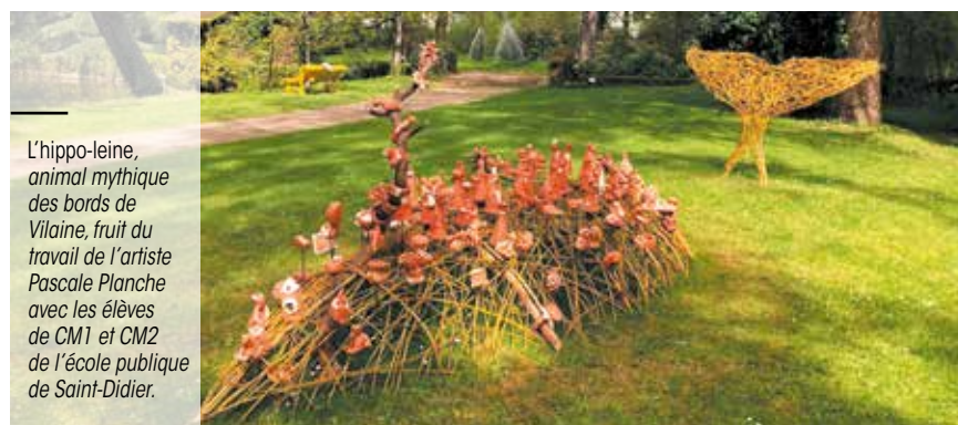
L'hippo-leine, animal mythique des bords de Vilaine, fruit du travail de l'artiste Pascale Planche avec les élèves de CM1 et CM2 de l'école publique de Saint-Didier.

Jardin des Arts, porté par l'association Les Entrepreneurs Mécènes, est le grand rendez-vous de la sculpture et du monumental. Cette 22 e édition invite le public à un voyage artistique à travers une vingtaine d'œuvres aux univers oniriques, réalistes ou fantastiques.