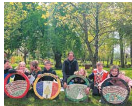
La flamme des CE2, œuvre d'élèves de l'école Les Glycines de Domagné, réalisée sous l'égide de Caroline Salles, créatrice de mosaïques.