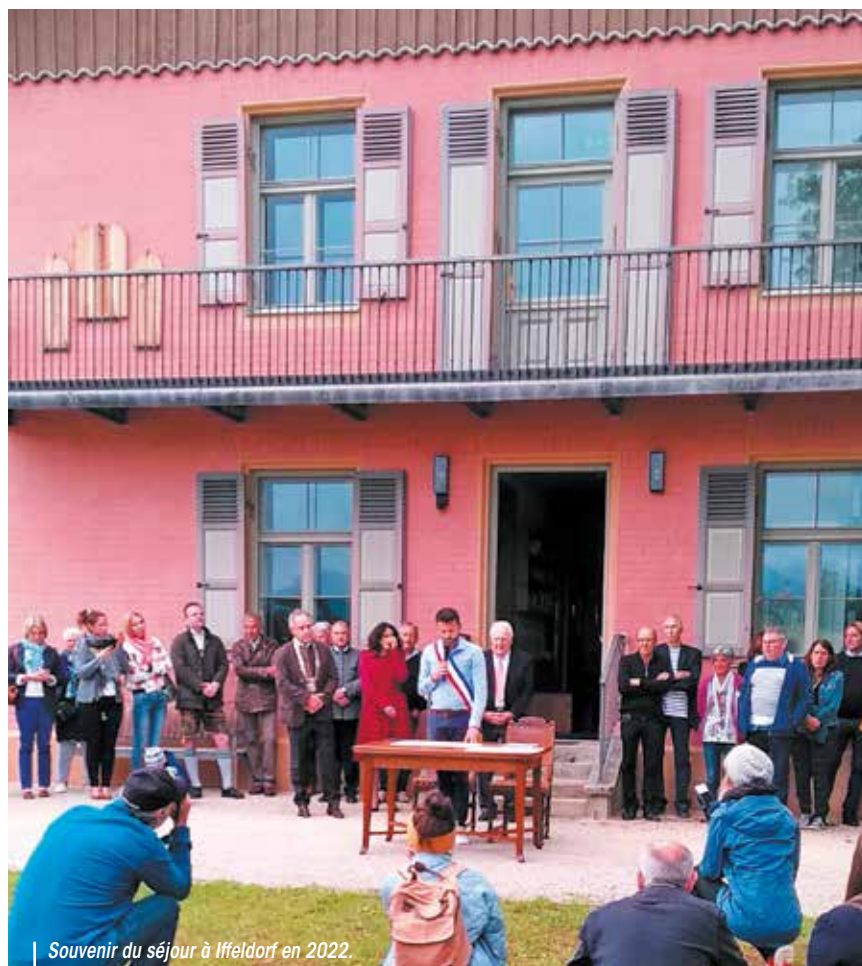
Souvenir du séjour à Iffeldorf en 2022.

L'association compte aujourd'hui environ 130 adhérents, qui restent bien souvent impliqués au Comité durant de longues années, car des liens durables se tissent entre les deux délégations. « Certaines amitiés durent depuis plus de 40 ans entre les familles castelbourgeoises et bavaroises. Nous sommes toujours ravis d'accueillir de nouveaux membres motivés, mais contraints par le nombre d'adhérents pouvant participer au séjour à Iffeldorf tous les 4 ans », explique le président du Comité. Une limite organisationnelle bien compréhensible lorsque l'on découvre le programme de chaque voyage : visites de la région en