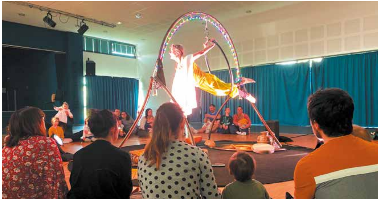
16 mars Festi'Mômes : Le festival dédié aux enfants de 0 à 6 ans s'est terminé en beauté avec le spectacle « Circle » animé par la compagnie Les Voyageurs mobiles, à salle de la Clé des champs.