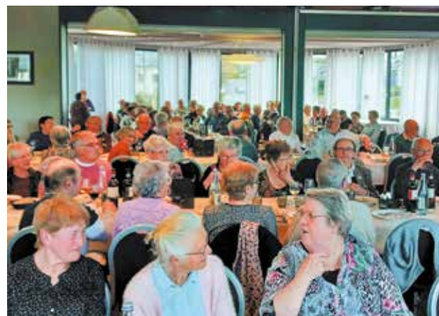
Avril Les trois repas des seniors , organisés par le CCAS, ont rassemblé près de 300 convives.