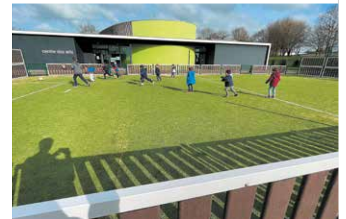
8 mars Un nouveau city stade a ouvert au public rue Olympe de Gouges, devant le Centre des Arts.