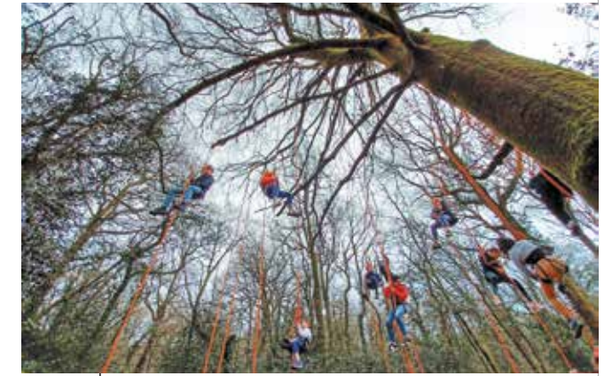
29 fév Sortie "grimpé d'arbres" à Thorigné-Fouillard avec l'association Là-haut, organisé par l'Espace Jeunes pendant les vacances d'hiver.