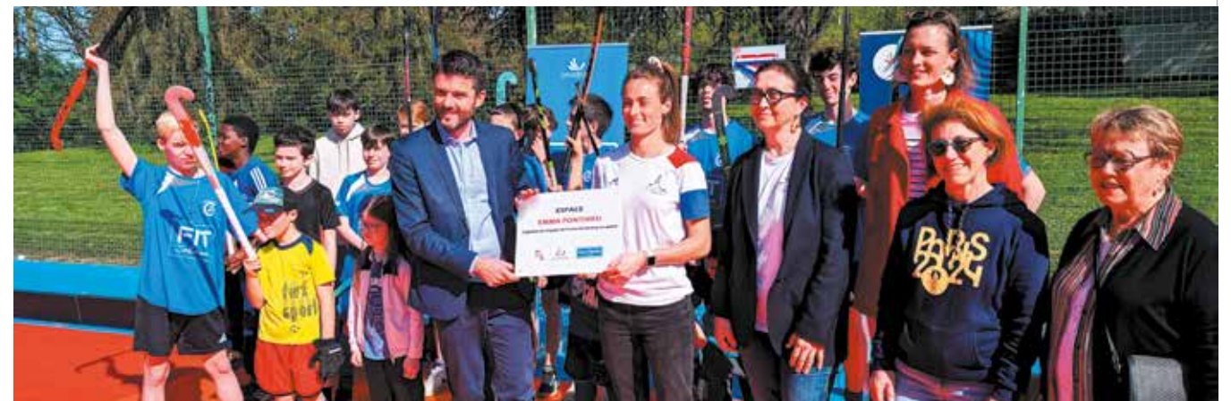
13 avril Le nouveau terrain de hockey sur gazon a été inauguré en présence d'Emma Ponthieu, capitaine de l'équipe de France de hockey sur gazon.