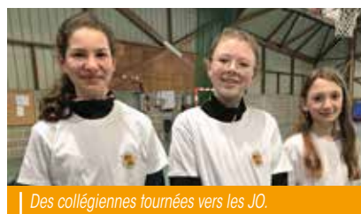
Des collégiennes tournées vers les JO.