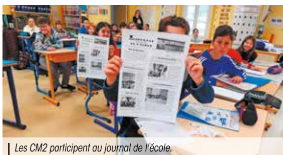
Les CM2 participent au journal de l'école.

L'école Charles de Gaulle n'aura pas attendu son extension pour se donner un peu de nouveauté. En effet, un journal interne a vu le jour cette année.