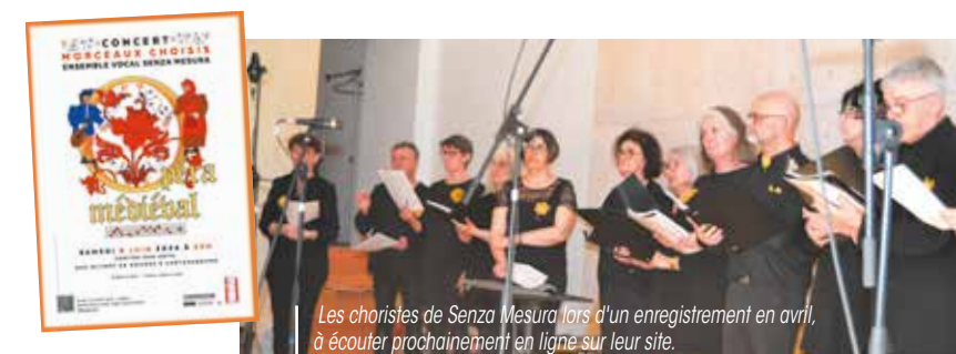
Les choristes de Senza Mesura lors d'un enregistrement en avril, à écouter prochainement en ligne sur leur site.

Au cœur du projet, le Livre Vermeil de Montserrat, une compilation de chants anonymes de pèlerins de la fin du 14 ème siècle, œuvre miraculée de l'incendie dont fut victime l'abbaye catalane de Montserrat, durant les conquêtes napoléoniennes. L'opéra sera complété par d'autres chants datant des 15 ème et 16 ème siècle. L'opéra spectacle prendra l'allure d'un road movie entre Paris et la Catalogne, né d'un scénario rédigé par un