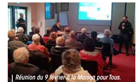
Réunion du 9 février à la Maison pour Tous.

Enfin, s'inscrire à l'opération Tranquillité vacances permet d'assurer une surveillance de votre logement par les services de police ou de gendarmerie en cas d'absence.