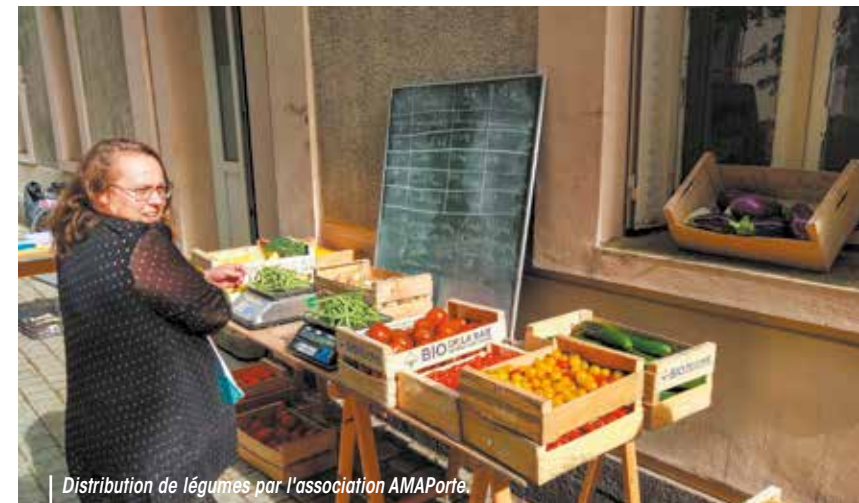
Distribution de légumes par l'association AMAPorte.

Après la venue de trois associations culturelles à la salle de la grange à l'automne, l'espace des Tours Carrées s'apprête à accueillir une nouvelle association, avec l'arrivée d'AMAPorte en mai.