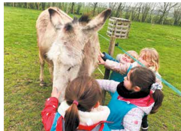
Fév Des enfants de l' Accueil de Loisirs ont pu profiter d'une sortie à la ferme, à Rannée, pendant les vacances d'hiver.