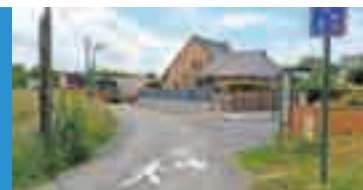
Une zone de rencontre.

D'une manière générale, il convient pour tous d'être vigilants et d'adapter sa vitesse et son comportement à l'environnement où on se trouve. Merci à tous !