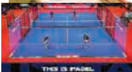
Un court de padel.

Le padel se joue en double, sur un terrain de vingt mètres sur dix, fermé par des vitres en plexiglas sur lesquelles la balle peut rebondir avant d'être jouée. Une idée qui nous vient du Mexique où un joueur eut l'idée, en 1969, de construire un mur pour récupérer des balles qui seraient allées chez son voisin.