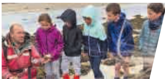
Les élèves attentifs aux explications d'un animateur de la LPO.

On apprend toujours mieux sur le terrain. C'est le principe de la pédagogie active pour favoriser les apprentissages sur la durée.