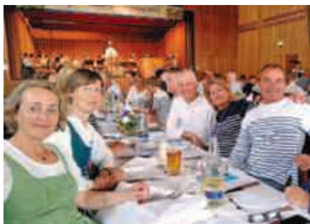
28 mai | Une joyeuse tablée !