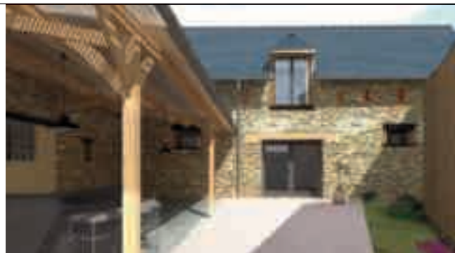
L'esquisse du pôle associatif et culturel, dans la grange située à l'arrière de la bibliothèque.

Pour parvenir à l'équilibre du budget primitif du CCAS pour 2022, une subvention de 142 000 €, versée par la Ville, est nécessaire. Dans cette enveloppe, 5 000 € sont dédiés à l'amorçage d'un fond de soutien géré par le CCAS, à destination des familles accueillant des réfugiés ukrainiens. Ainsi, le Conseil municipal a approuvé le versement de cette subvention spécifique, en faveur du CCAS.