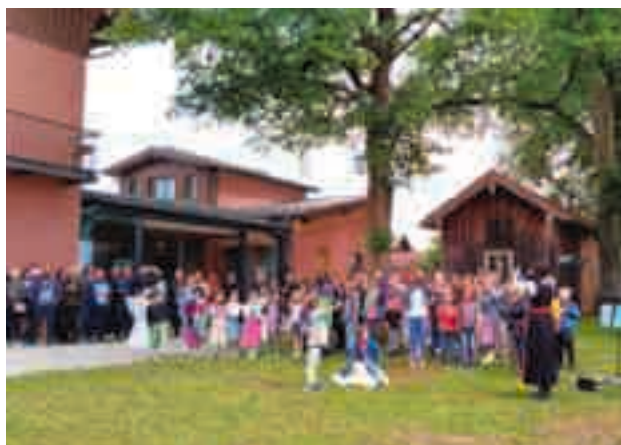
29 mai | La chorale des enfants d'Iffeldorf.