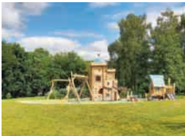
31 mai | Enfin un château : la nouvelle aire de jeu du parc Bel Air a fière allure et ravit les petits (mais pas seulement...).