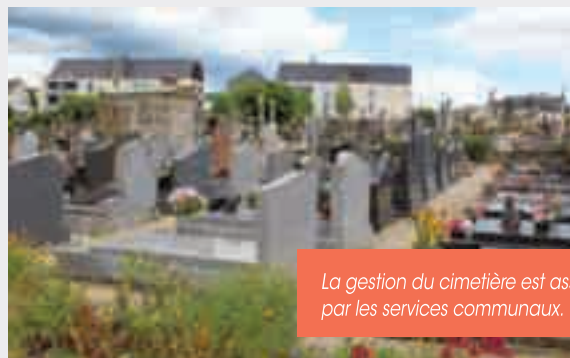
La gestion du cimetière est assurée par les services communaux.