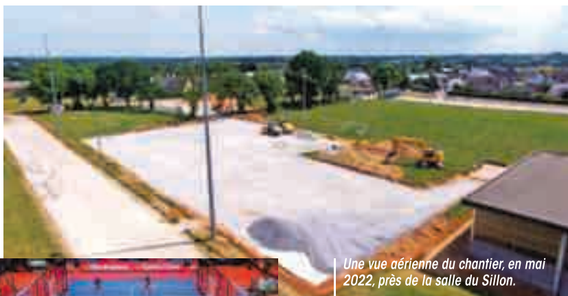
Une vue aérienne du chantier, en mai 2022, près de la salle du Sillon.

Le sport de raquettes poursuit son envolée à Châteaubourg. La Ville réalise actuellement un nouvel équipement qui devrait connaître une belle affluence, dès septembre 2022. Au programme deux courts de tennis en terre battue synthétique et deux de padel. Le tout en plein air, entre les salles de l'Envolée et du Sillon.