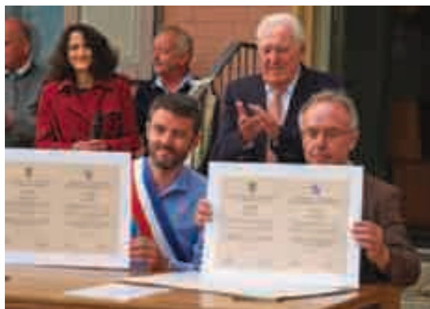
29 mai | Signature de la convention de jumelage : les 2 maires signent solennellement le renouvellement de la charte de jumelage.