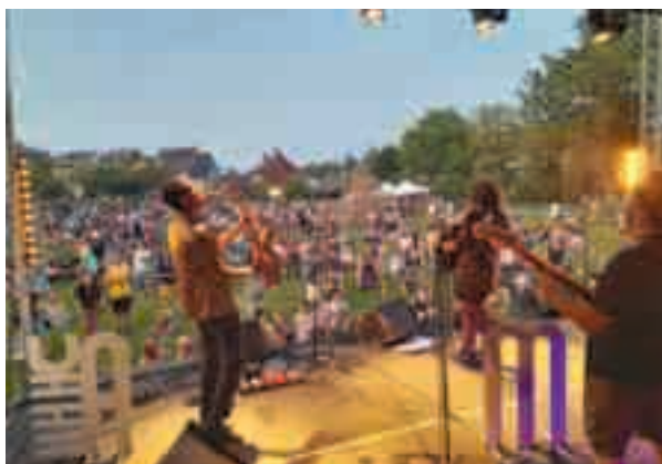
17 juin | Fête de la Musique : une édition chaude et festive !