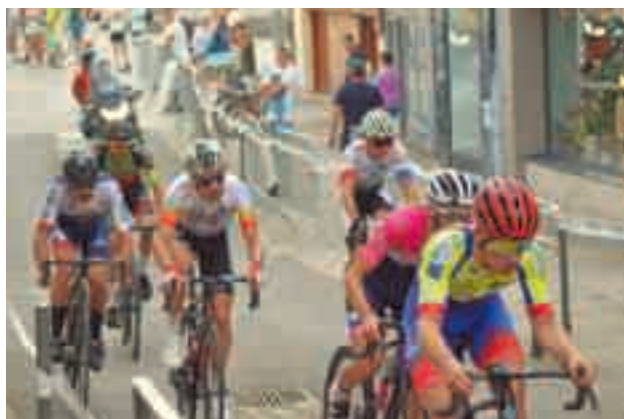
18 juin | Castel'inator : la course cycliste par élimination a tenu toutes ses promesses avec un beau spectacle sportif !