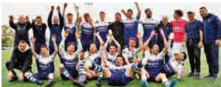
Dimanche 24 avril : L'équipe fanion du SCFC vient d'accéder en Régionale 3 après le match contre Liffré.

L'autoroute de la victoire était déjà toute tracée quand le SCFC - Stade Castelbourgeois Football Club - a écrasé l'US Liffré sur le score de 5 à 0, le dimanche 24 avril 2022, au stade Théo Bottier. Une victoire mémorable qui validait une montée en Régionale 3, pour la première saison du jeune club. L'objectif sportif de la fusion est donc largement atteint.