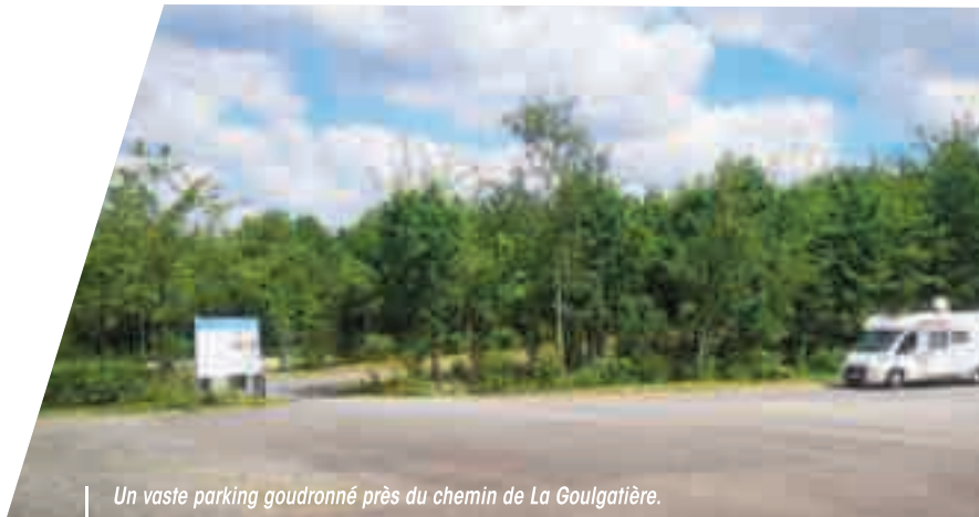
Un vaste parking goudronné près du chemin de La Goulgatière.