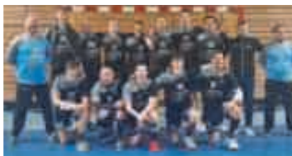
L'équipe fanion du HBCC, lors de sa montée en Régionale, le 30 avril 2022.

19 matchs, 19 victoires en handball. Difficile de faire mieux pour l'équipe fanion des seniors garçons du HBCC. Un résultat qui conduit automatiquement à la montée en division supérieure.