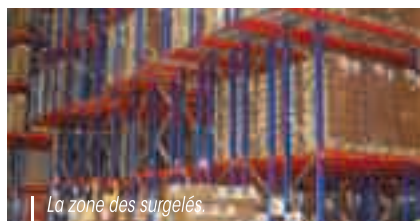
La zone des surgelés.

Revenons à Châteaubourg. Quelle est exactement l'activité du site ? « Nous transportons les