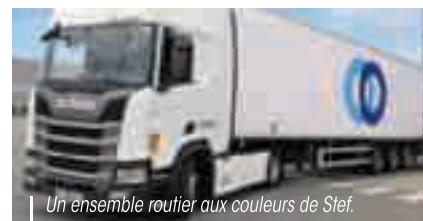
Un ensemble routier aux couleurs de Stef.