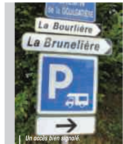
Un accès bien signalé.

Avec un accès facile, en provenance de la voie express. Après le rond-point d'entrée de ville, il suffit de tourner à droite, au chemin de La Goulgatière pour atteindre la nouvelle aire, allée du Vent d'Autan. Il s'agit d'un ancien parking très vaste, situé à hauteur de l'ancien site Sulky et actuel centre commercial. Le sol est goudronné donc bien stabilisé : bien pratique pour des véhicules qui pèsent autour des 3,5 tonnes.