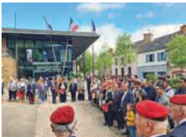
8 juin | Hommage aux combattants en Indochine : Châteaubourg a accueilli la commémoration pour les combattants en Indochine, en lien avec l'UNC et l'association Hmong 35, joliment représentée.