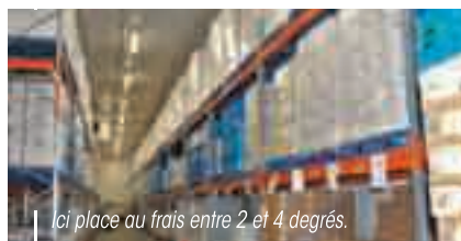
Ici place au frais entre 2 et 4 degrés.