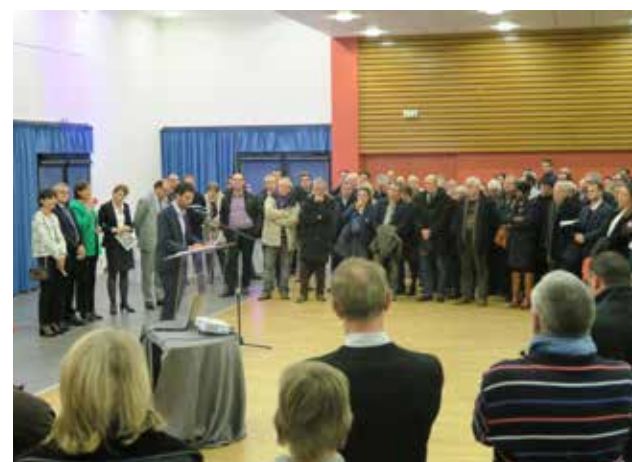
19 janv. Vœux du maire aux responsables associatifs, entreprises et partenaires.