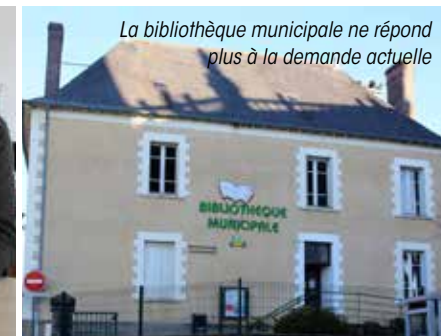
La bibliothèque municipale ne répond plus à la demande actuelle

à maîtrise d'ouvrage a été confiée au cabinet parisien Aubry et Guiguet Programmation, pour huit mois d'études.