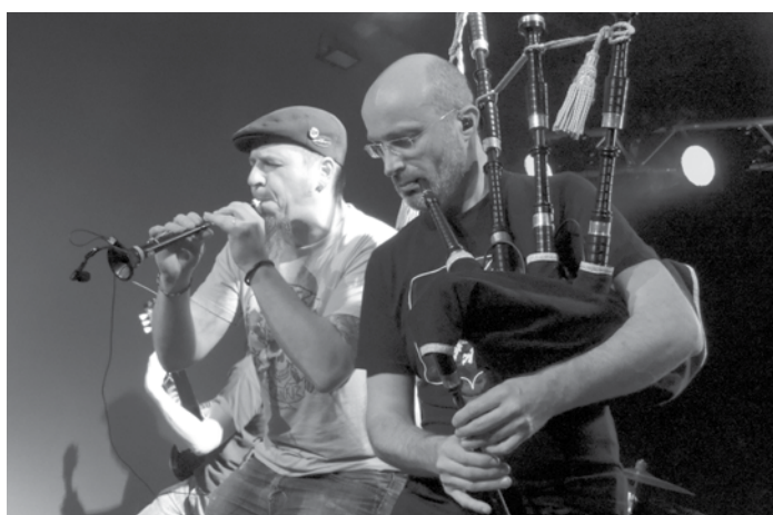
14 janv. Coup d'envoi de la Saison de Janv'ril : soirée fest noz organisée par Le Bon Scén'art.