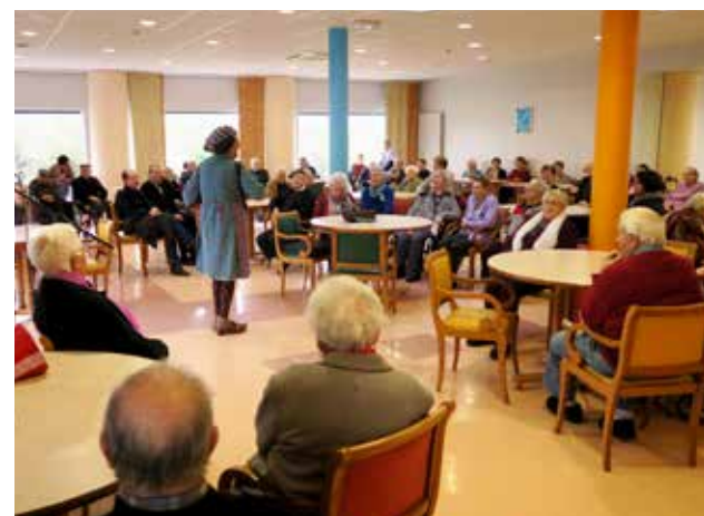
27 janv. Vœux aux résidents de Sainte-Marie : instants conviviaux.