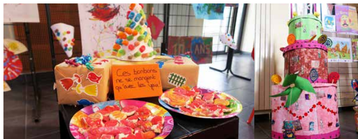
4 fév. Festi'Mômes 2017 : une exposition gourmande pour les tout-petits.