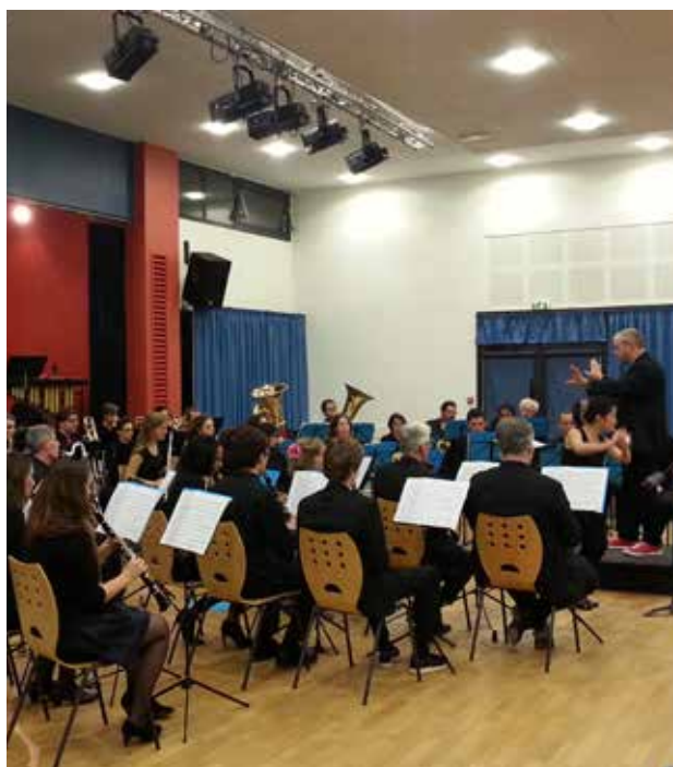
7 janv. Concert de l'Orchestre d'Harmonie de Rennes , invité par l'association Musique aux portes.