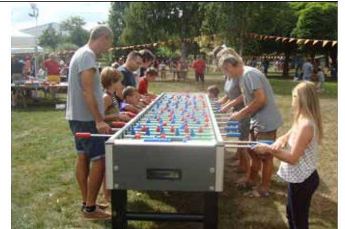
La Fête du jeu, organisée tous les ans par la Ludothèque au parc Pasteur

La Commune assure le service public d'assainissement collectif, actuellement réalisé via une délégation de service public à la société Véolia. Cette mission prendra fin au 31 décembre 2017. Afin de choisir le mode de gestion le plus adapté, un rapport présentant notamment les caractéristiques des prestations que devra assurer le futur délégataire a été réalisé. Il résulte de ce rapport que le mode de gestion le plus adapté est la gestion déléguée dans le cadre d'un contrat de concession de type délégation de service public. Ce contrat, d'une durée de 10 ans, aura pour objet l'exploitation du service public d'assainissement, y compris le traitement et la collecte de l'eau. Le Conseil municipal a approuvé le principe de délégation ainsi que les caractéristiques des prestations à assurer et a validé le lancement de la consultation.