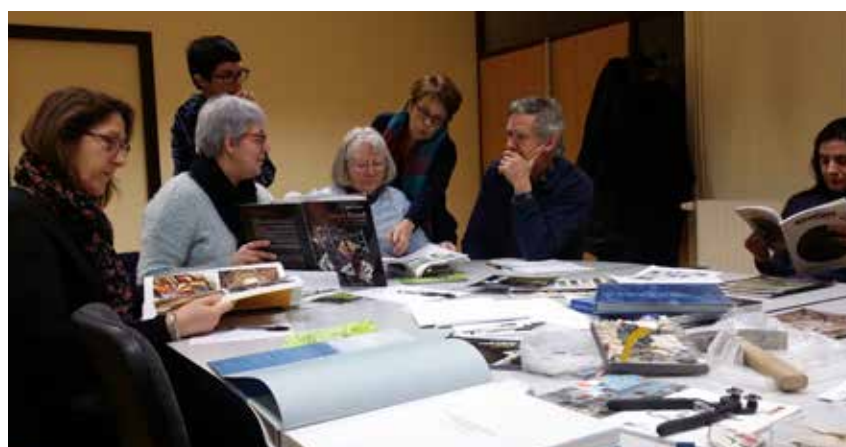
23 janv. Sculpture participative : le groupe de réflexion à l'œuvre !