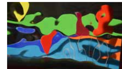
« PSYCHÉS » au parc Bel Air

« Immobile, vous fixez l'œuvre : une pierre brute, granitique, cubique et tellurique supporte une matière évanescence aux contours indéfinis où se disputent la fluidité et la transparence. Rien ne bouge, le temps est comme suspendu. Oubliez la matrice originelle [...] oubliez la technique [...]. Vous devinez les subtiles concavités et convexités polies à l'extrême qui imposent à la lumière des trajectoires imprévisibles. » Franck K, à propos de Psychés