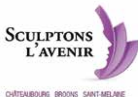
Les élus de la majorité

L'enjeu consiste bel et bien à maîtriser notre démographie plutôt que de la subir et éviter des variations trop importantes du nombre de constructions que nous avons connu ces dernières années. Cela déstabiliserait nos écoles, nos infrastructures, nos associations... Nous devons donc veiller à lisser les opérations d'aménagement afin de réussir un développement régulier. C'est là l'enjeu de la ZAC multi-sites. N'oublions surtout pas le contournement de Châteaubourg : il déterminera nos choix en matière de cadencement des nouveaux lotissements. En 2017, ce contournement de Châteaubourg sera donc au cœur de nos discussions avec l'État et le Département.