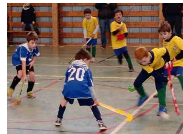
21 janv. Championnat de Bretagne de hockey , accueilli par le Châteaubourg Hockey Club.