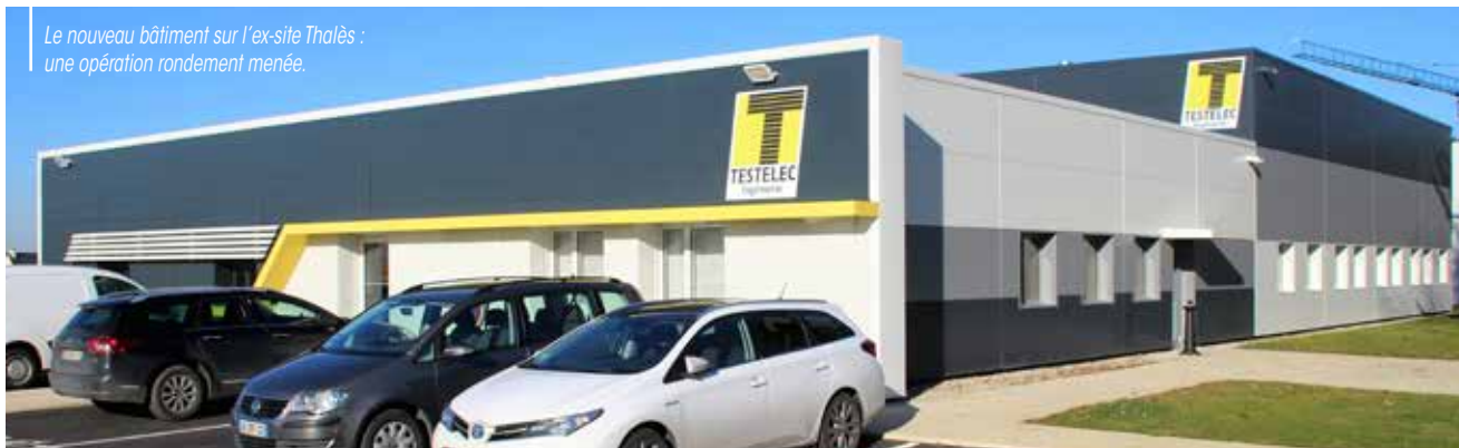
Le nouveau bâtiment sur l'ex-site Thalès : une opération rondement menée.