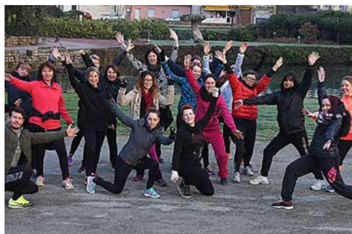
8 janv. Week-end detox organisé par Castel Loisirs et Sports. Une première très appréciée !