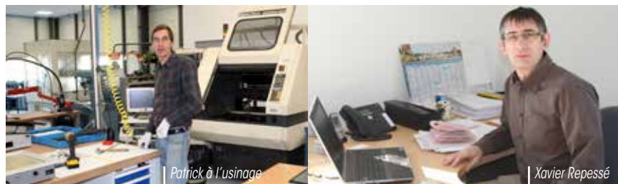
Patrick à l'usinage

De la commande centralisée de votre voiture à la dernière cafetière high-tech, vous avez sans doute utilisé un produit vérifié par un banc de test Testelec Ingénierie. L'entreprise surfe sur l'envolée de l'électronique.