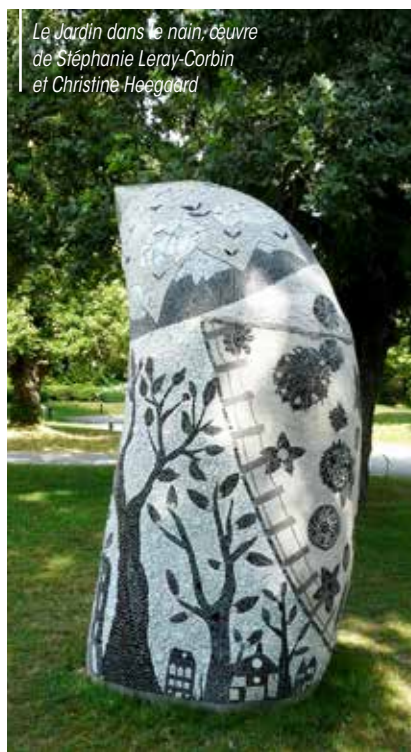
Le Jardin dans le pain, œuvre de Stéphanie Leray-Corbin et Christine Heegaard

Un petit groupe de travail, composé d'habitants de la commune, s'est réuni pour échanger sur la thématique retenue, le bien-vivre ensemble, et découvrir les formes que peuvent prendre des sculptures en mosaïque. De ces échanges, une esquisse a été couchée sur le papier par l'artiste. Nous en profitons pour remercier tous les parti-