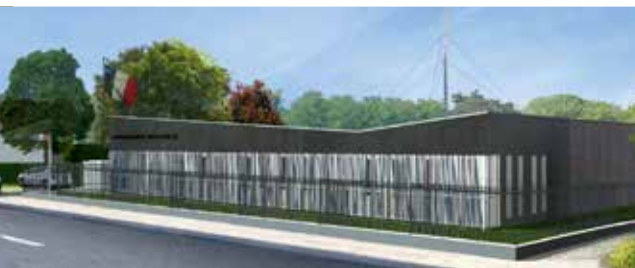
La future gendarmerie, en 2018