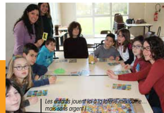
Les enfants jouent ici à la loterie mexicaine... mais sans argent !

Facebook : /diciailleurschateaubourg asso.dici.ailleurs@gmail.com 06 95 31 11 80