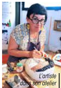
L'artiste dans son atelier

Dans le cadre de la Cité des Sculpteurs, la mairie a lancé un tout nouveau projet : une sculpture participative. Kézako ? Il s'agit d'intégrer les habitants, écoles, associations, partenaires... dans la création d'une œuvre originale pour la commune.