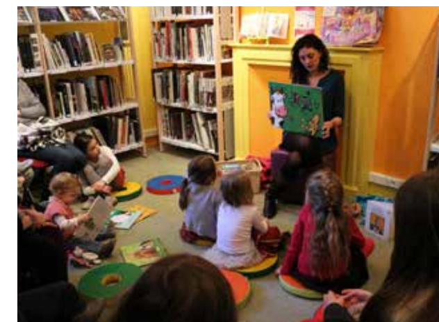
8 fév. Bibliothèque : l'heure du conte captive les petits.